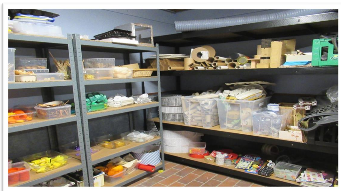
Billede fra ReMida rummet

Vi gør børnene opmærksomme på, at naturen er noget vi skal passe på og pleje. At vi ikke smider skrald når vi er på tur og samler ting op der ikke skal være i naturen. At vi kan bruge og genbruge ting igen og igen på mange forskellige måder. Vi bruger genbrugsmaterialer – ReMida -, til at bygge med, sortere og lege med. Vi opfordrer børnene og deres forældre at samle ting sammen vi kan bruge – pap rør, propper, kapsler, sjove pinde med mere. I børnehaven er børnene meget optaget af når de har haft noget med, og de er meget glade for at farvesortere det og lægge det i vores kasser, så det er klart at bruge. De har lært, at vi kan genbruge næsten alt.